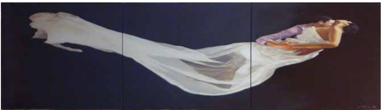
Flux – Anamorphose 306-09, 2009, Öl auf Leinwand, 89x390 cm / Flux – Anamorphose 323-10, 2010, Öl auf Leinwand, 100x360 cm