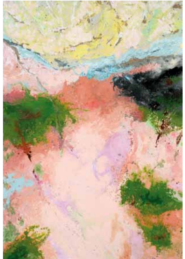
The Last Silent , 2009, Öl auf Leinwand, je 260x190 cm The Last Silent , 2009, oil on canvas, each 260x190 cm